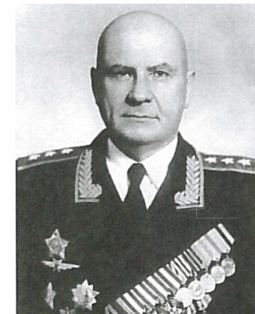
Генерал-полковник авиации Толстикова О.В. Первый заместитель Министра внутренних дел СССР по МПВО с 1956 г. по 1961 г.

5-6 октября 1948 года произошло землетрясение в столице Туркмении г. Ашхабаде, в результате которого число погибших составило свыше 176 000 человек. 240 тяжелых транспортных самолетов МПВО доставили в Ашхабад 1 265 медиков, 48 тонн медикаментов, 240 тонн продуктов, 5 тысяч армейских палаток.