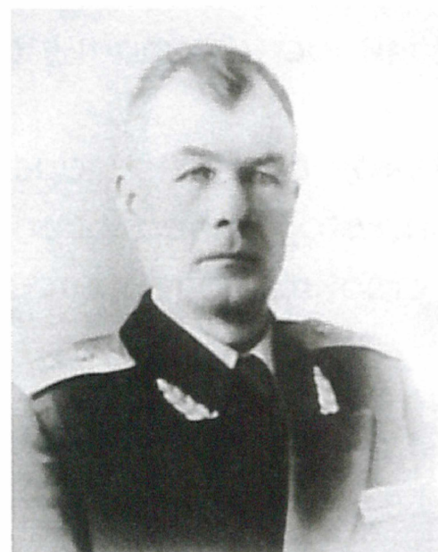
Генерал-лейтенант Шередега И.С. Начальник ГУ МПВО МВД СССР с 1950 г. по 1956 г.